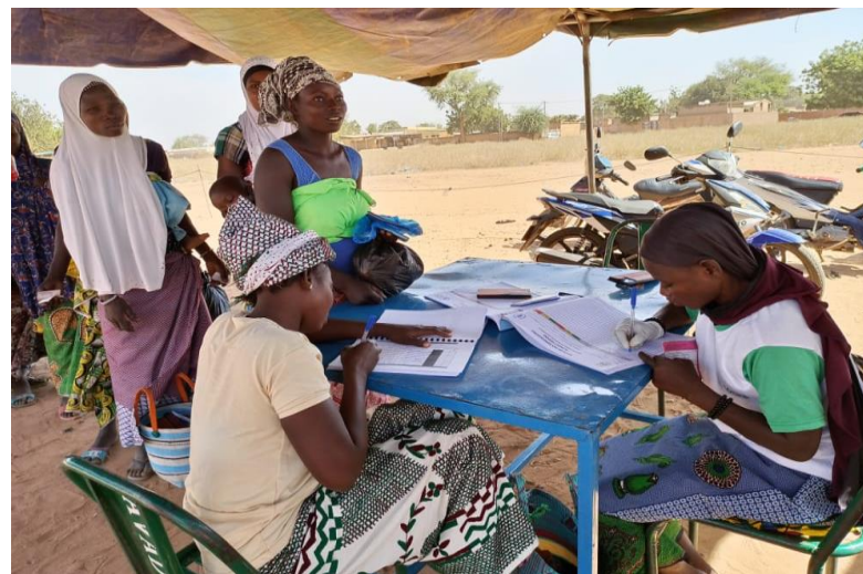
Distribution d'intrants nutritionnel (KAYA, Centre-nord)