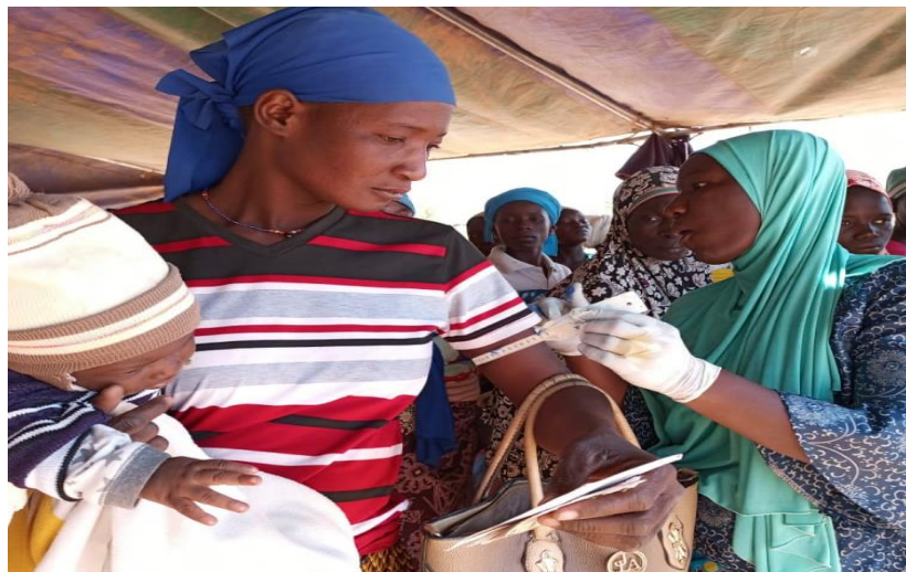
Dépistage des FEFA et enfants malnutris (KAYA, Centre-Nord)